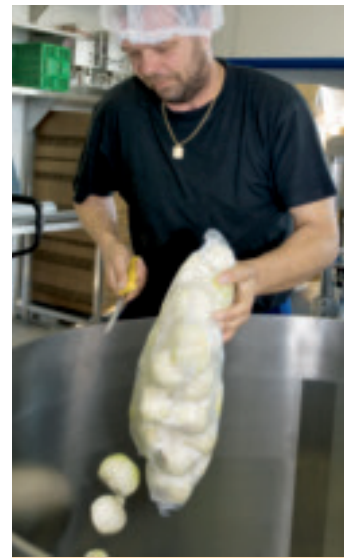
Würziges Geheimnis: Zwiebeln bringen den nötigen Pfiff in die Haus-Sauce.