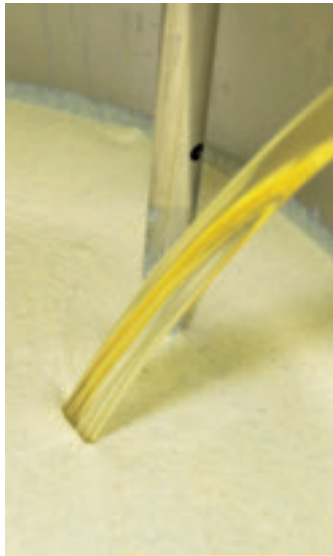
Gesunde Sache: Schweizer Rapsöl bildet die hochwertige Basis der Haus-Sauce.