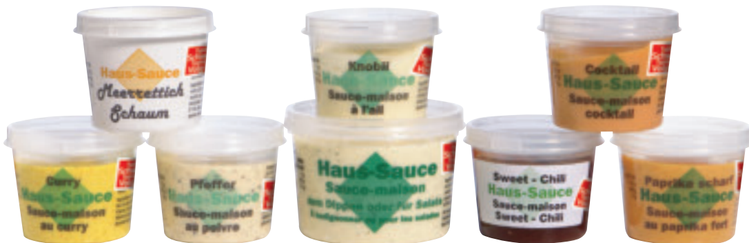
Ideal zum Dippen und als Beilage für Grilladen und Fondues: Haus-Saucen gibt es in acht gluschtigen Geschmacksrichtungen.

Volg engagiert sich für einheimische Hersteller! Ab 1. August liegt in Ihrem Volg-Laden ein Flyer auf, der Sie über alle Aspekte des neuen Labels «Typisch Schweiz – typisch Volg» informiert. Mit der neuen Etikette werden verschiedenste Schweizer Produkte ausgezeichnet, die nach Heimat riechen und schmecken: charaktervolle Backwaren und Confiserieartikel, typische Milchprodukte, hochklassige Weine und Spirituosen, Süssgetränke und Säfte, Müesli, Teigwaren, Früchte, Honig und Saucen. In Zukunft werden wir Ihnen im «Öise Lade» regelmässig «Typisch Schweiz – typisch Volg»-Produzenten vorstellen.