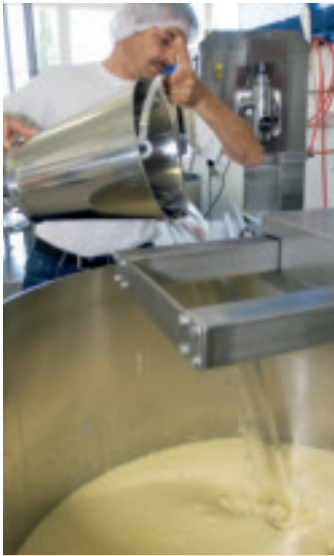
Vorsichtig verdünnt Toni Signer die Haus-Sauce, bis die Konsistenz perfekt ist.